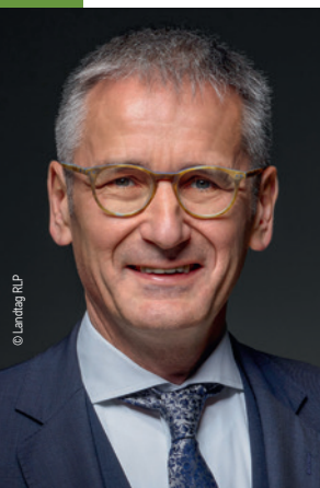
Hendrik Hering Präsident des Landtags Rheinland-Pfalz